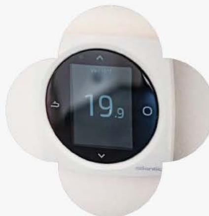
Domotique intégrée dans chaque appartement