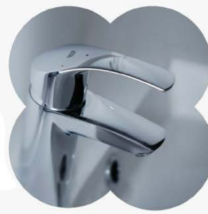
Robinetterie de la marque GROHE

Pour plus d'informations, n'hésitez pas à vous rapprocher de votre conseiller commercial au 06 59 98 22 50.