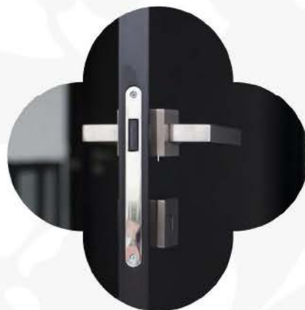
Finitions haut-de-gamme Produits modernes et de qualité