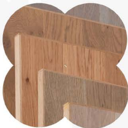
Parquet contre-collé Élégance et longévité

Découvrez ici certaines finitions incluses dans chaque appartement.