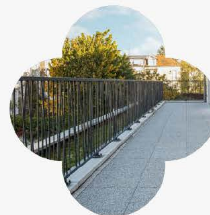
Extérieur privatif (1) pour chaque logement