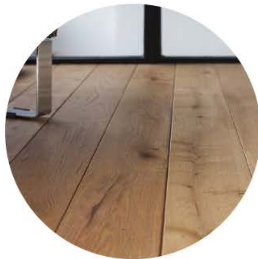
Parquet contre-collé Robustesse et longévité

Pour plus d'informations, n'hésitez pas à vous rapprocher de votre conseiller commercial au 06 59 98 22 50 .