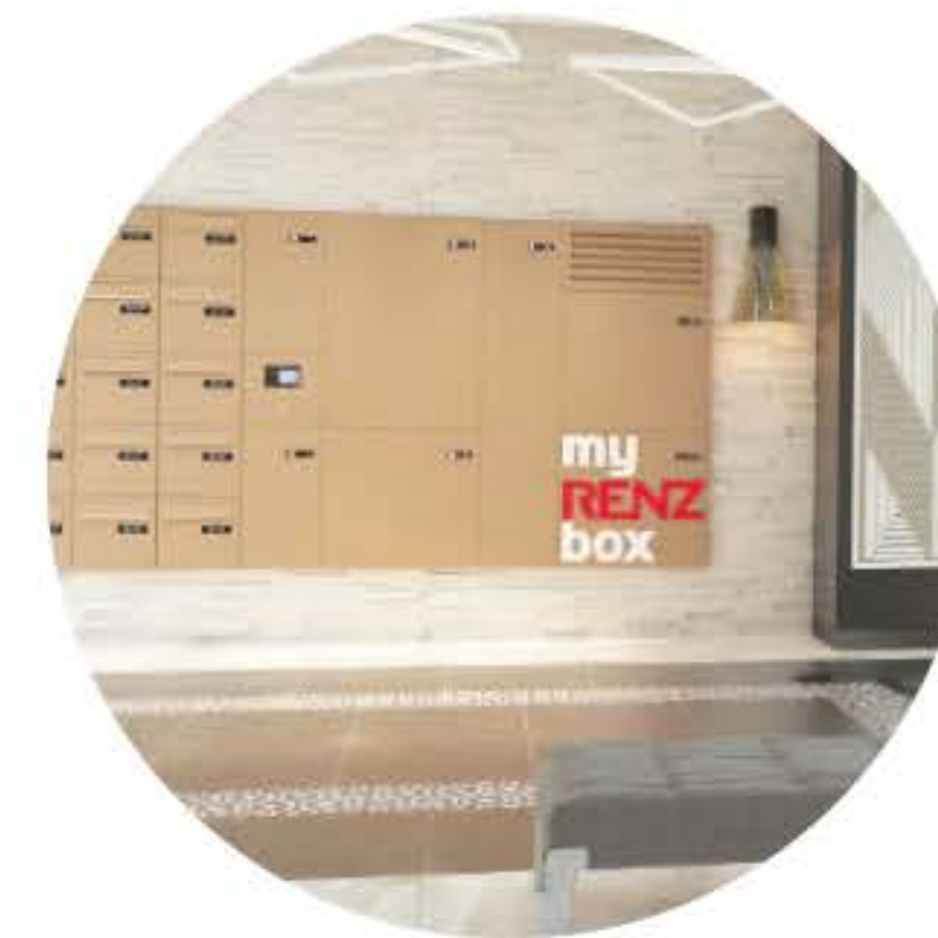
Boîtes aux lettres connectées