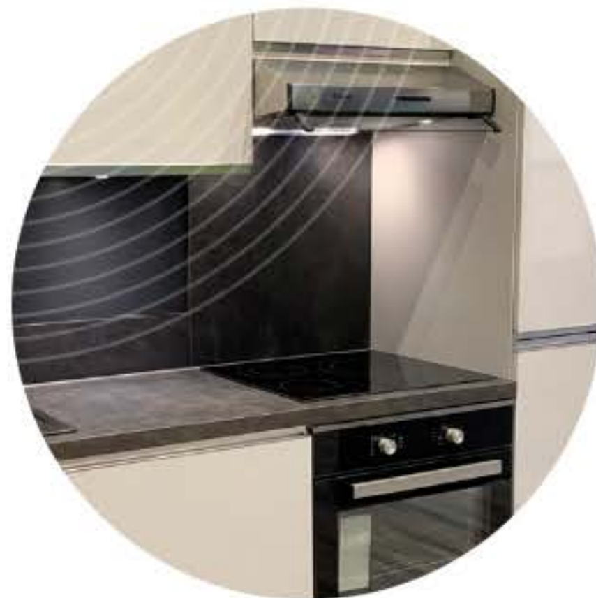
Cuisine équipée et aménagée du groupe Mobaipa