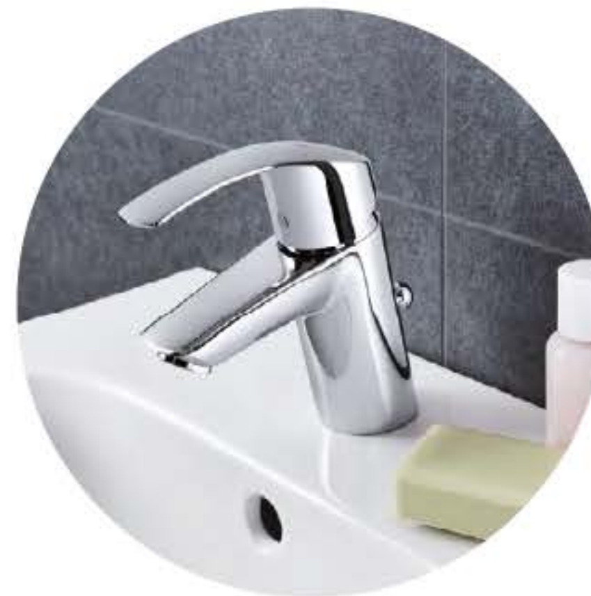
Robinetterie de la marque GROHE