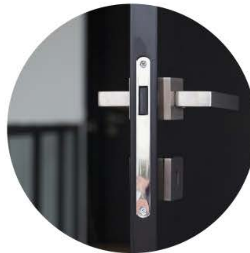
Finitions haut-de-gamme Produits modernes et de qualité