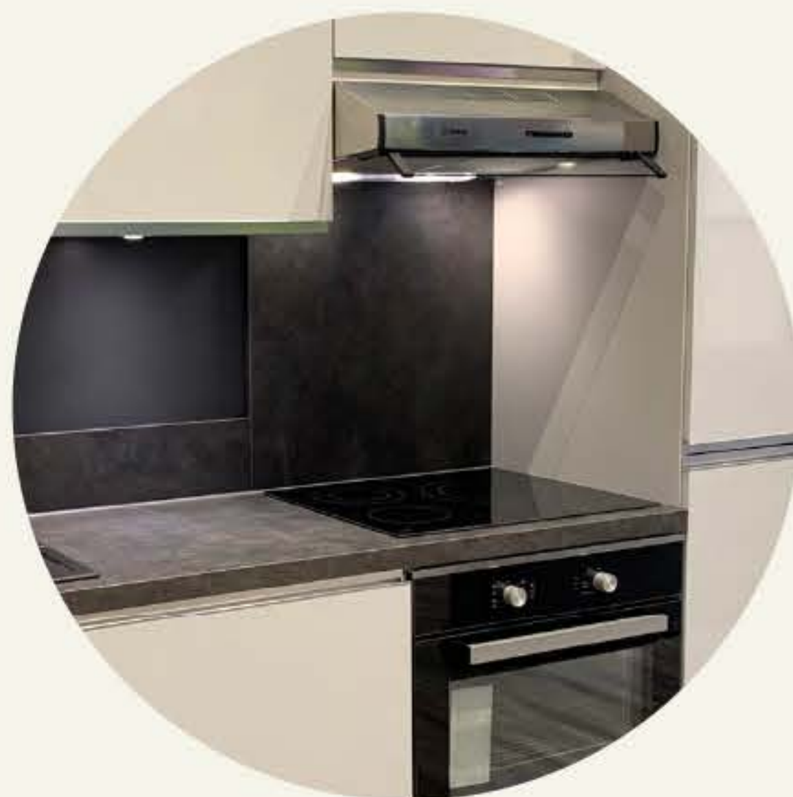
Cuisine équipée et aménagée du groupe Mobalpa®