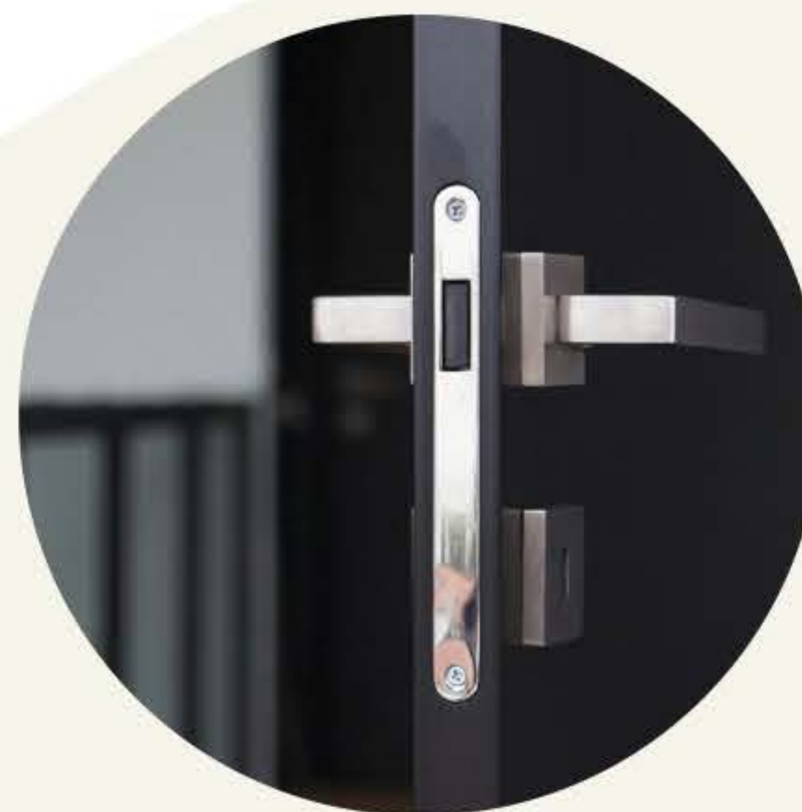
Finitions haut-de-gamme Produits modernes et de qualité