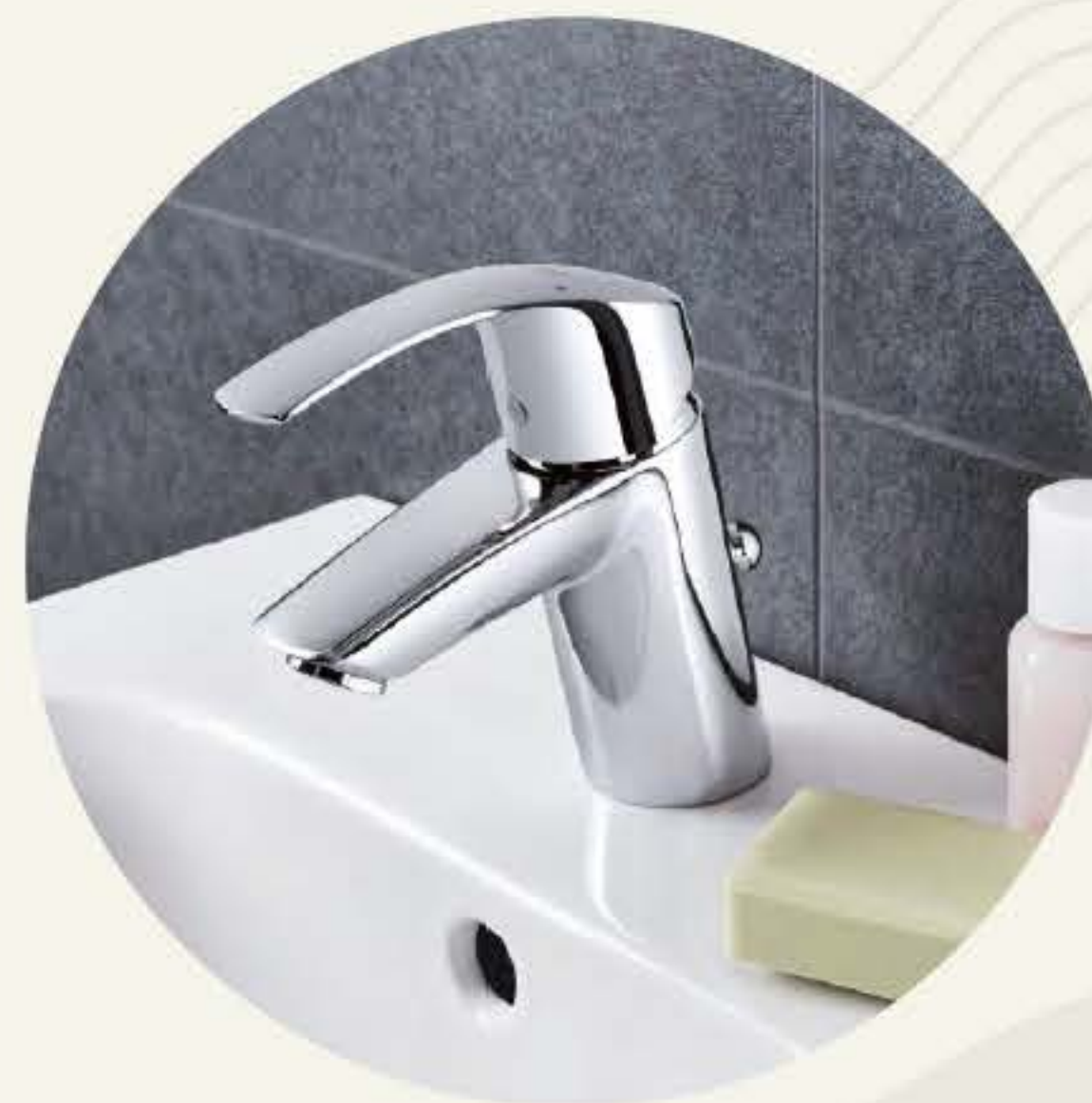
Robinetterie de la marque GROHE