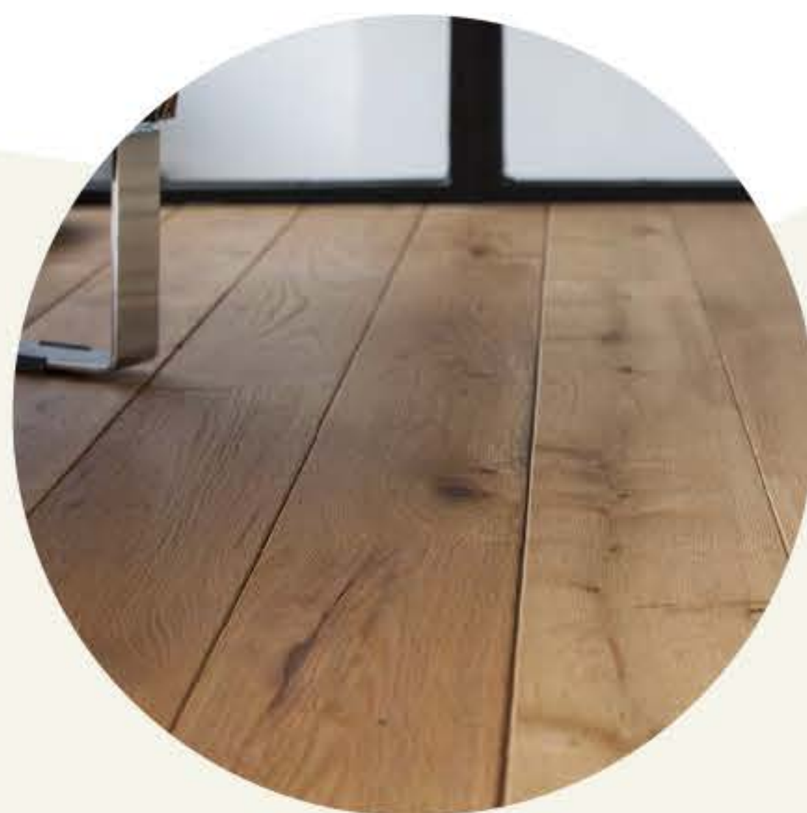
Parquet contre-collé Robustesse et longévité

Pour plus d'informations, n'hésitez pas à vous rapprocher de votre conseiller commercial au 06 59 98 22 50 .