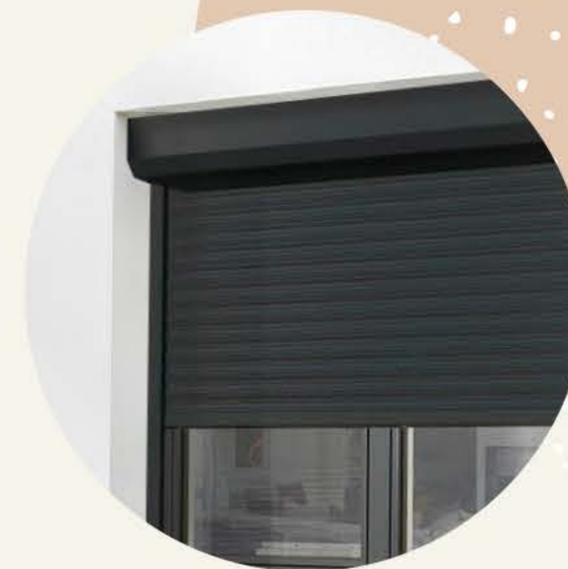
Volets roulants électriques