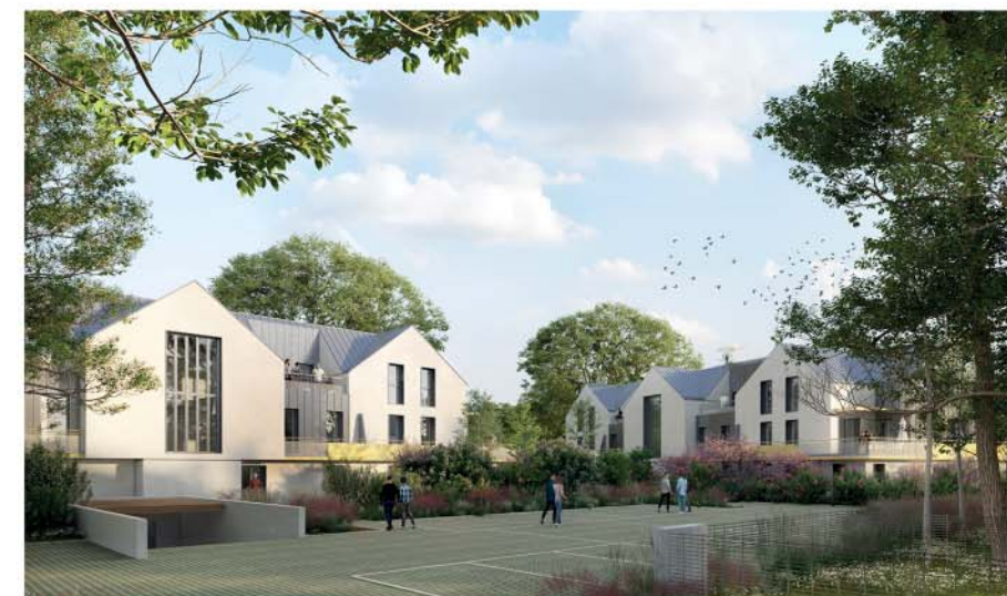
PANORAMA Angle de la rue Bernard de Jussieu et de la rue de Meaux