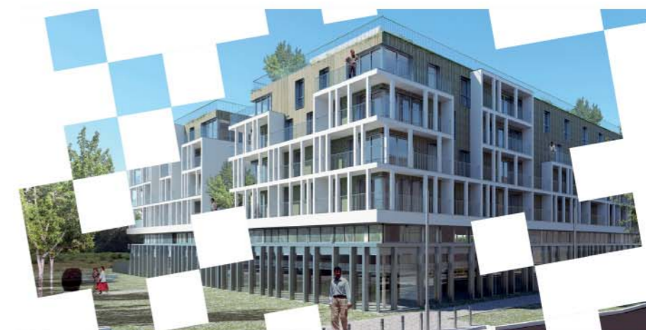
DAME SQUARE, au Val d'Europe Rue d'Amsterdam, 77144 Montévrain