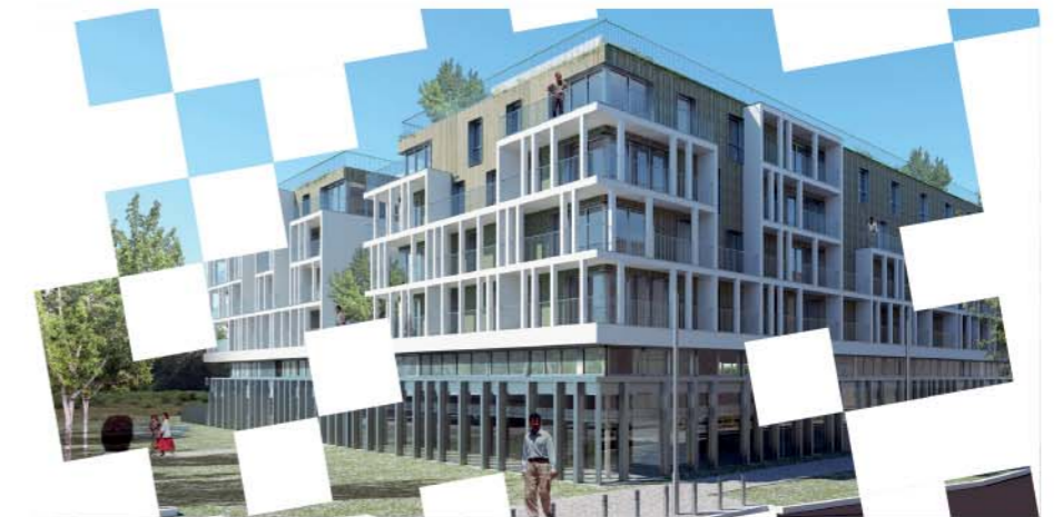
DAME SQUARE, au Val d'Europe Rue d'Amsterdam, 77144 Montévrain